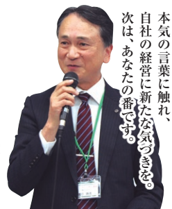
樋口県経営労働委員長

ここに次年度の「経営指針を創る会」受講をお考えの皆様、そして受講生を応援したい皆様もぜひご参加ください。 入会候補の方のお誘いも大歓迎です。